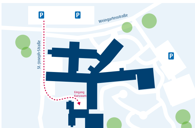
Offenburg St. Josefsklinik